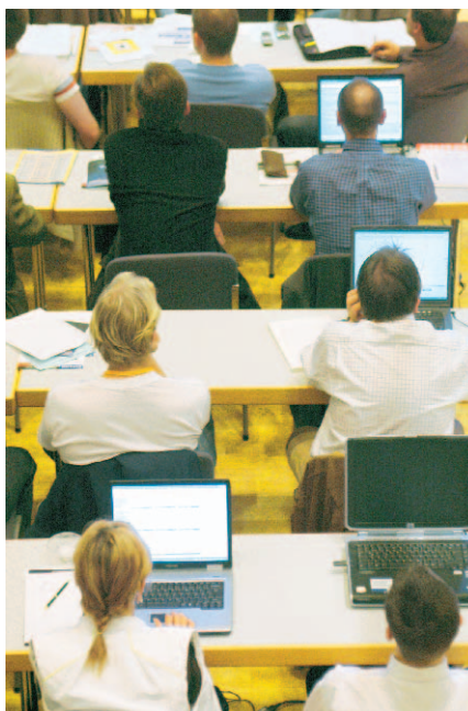
Gespannt und voll konzentriert haben die Besucher die Vorträge und die Handelsergebnisse der Referenten verfolgt und nachvollzogen.

Empfehlenswert ist die so genannte Market Map: Die Performance von US-Sektoren und Aktien wird auf einen Blick deutlich.