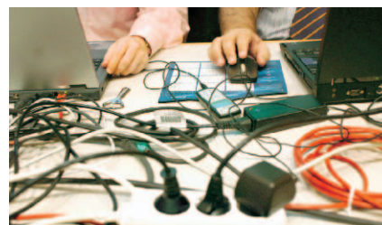
TRADING HERBST 2006