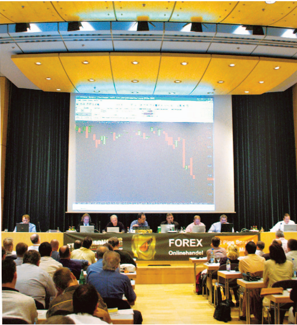
Die meisten Trader handeln im Marktsegment Forex, also Devisen. Aber auch Index- und Anleihen-Futures sowie Aktien waren auf der Trading-Veranstaltung in Aschaffenburg gefragt.